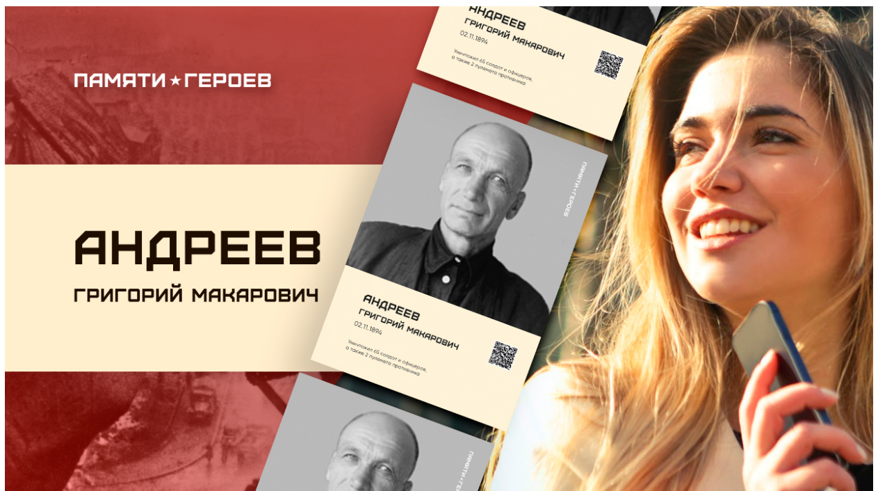
Рис. 3. Образец превью на загружаемый ролик о Герое. Шаблон .psd во вложении.